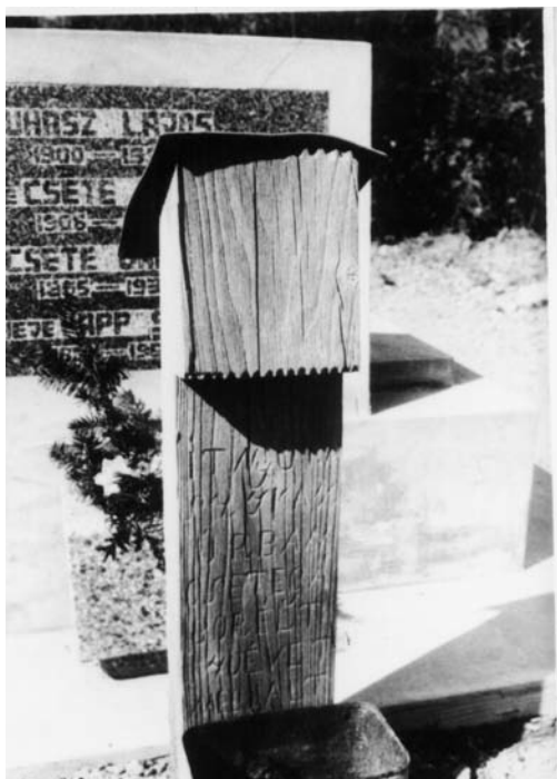
Itt nyugszik úrban Csete Gábor élt, 75 évet. Meghalt (1935-ben)

A sírhely megjelölésére valamikor csak akácfából készült fejfát tettek. A faanyagot a család előre biztosította egy-egy megfelelő méretű kivágott fából, a bognár pedig belevészte a szükséges adatokat.