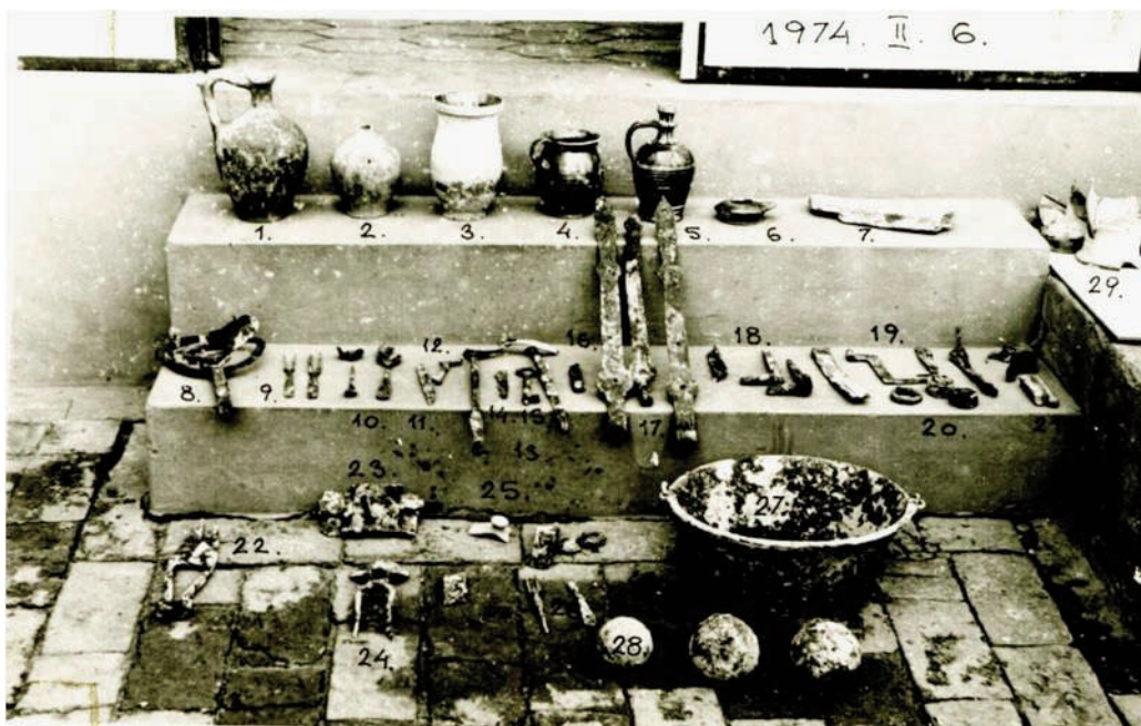
A rejtkehelyen megtalált tárgyak