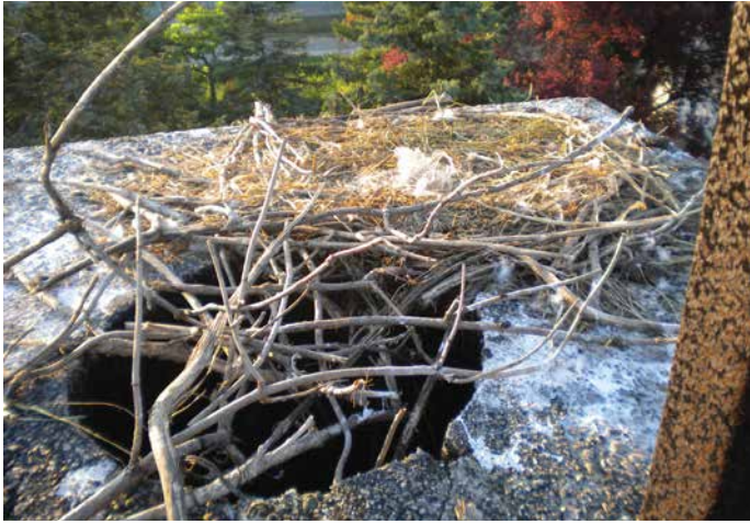
Az első fészek

2010-ben a szövetkezeti otthon kéményére letelepedett egy gólyapár. Fészekrakást még csak akkor tanulhatták. Sajnos azt a kezdetlegest is meg kellett semmisíteni kéménypucoláskor. Bizva, hogy visszajön a gólyapár a helyi Nikola Đurkovič iskola mesterei egy ketrecet szereltek fel a kéményre. Azóta is minden évben haza jönnek fészükbe. Mert itt a hazájuk és itt nevelik fel nagy gonddal kicsinyeket, nem pedig Afrikában.