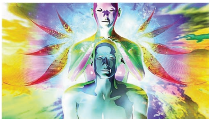
Öngyógyítás. A pozitív gondolkodás képes meggyógyítani a testet.

betegségtől való félelemben él, az azt meg is fogja kapni. Az aggodalom hamar leépíti az egész testet, engedi, hogy a betegség eluralkodjon bennünk. A test egy érzékeny és képlékeny hangszer, amely hamar válaszol azokra a gondolatokra, melyek hatással vannak rá, és a gondolatok meghozzák saját ered-