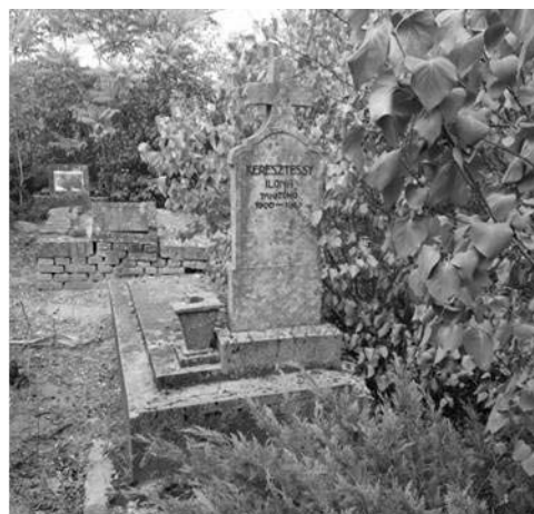
Keresztesi Ilona sírja a bácsfeketehegyi temető nyugati részén

Megjelent: Das Donau-Magazin Nr. 219 vom 1. September 2021