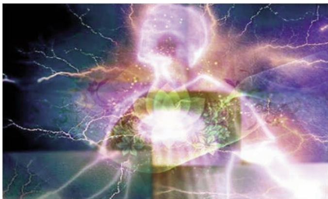
A negatív gondolatok kihatnak érzelmeinkre, de testünkre is.

A betegség és az egészség is a gondolatokban gyökereznek. Gondolataink és érzéseink azok, amelyek megbetegítenek vagy meggyógyítanak. Beteges gondolatok, beteg testben fognak kifejezésre jutni. Gondoljunk csak az utóbbi időben eluralkodott félelemmel teli világra, hogy mennyi keserűséget, megbetegedést, tragédiát okozott környezetünkben. Aki túl sokat gondol egy betegsége, valamilyen